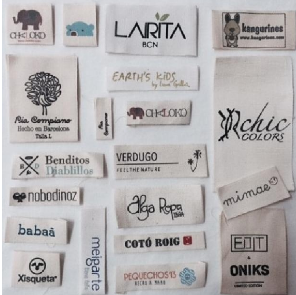
Megatex, fabricante etiquetas