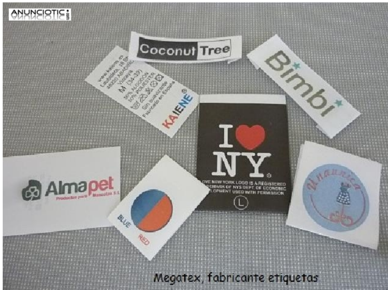
Megatex, fabricante etiquetas