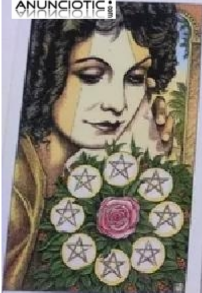
Eight of Pentacles